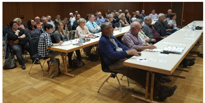
Wie alles begann: Impression der Auftaktveranstaltung am 28.03.2017

Zu Weiterbildungszwecken und Aufbau eines Netzwerks nahm das Regionalmanagement an zehn Netzwerktreffen und Weiterbildungen teil.